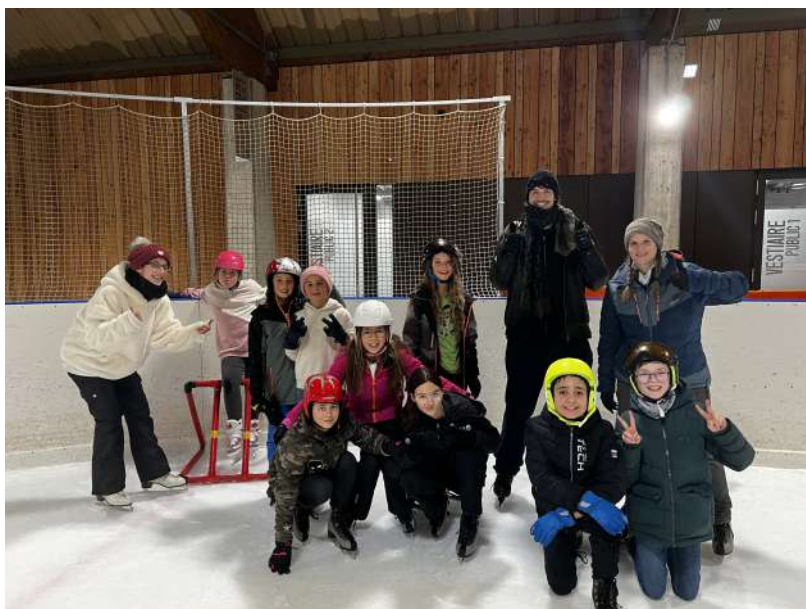
Sortie à la patinoire des Paccots pour clôturer l'année 2023