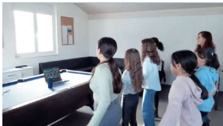
Just'Dance à Bossonnens

Un projet peut être autant la mise en place d'une activité lors d'un accueil, qu'un événement ou encore un atelier ou une activité hors temps d'accueil. La grandeur du projet importe peu. Ce qui importe l'équipe professionnelle est le processus. En effet, parfois des projets ne peuvent pas se concrétiser dans la matière pour diverses raisons. Parfois les jeunes renoncent à leur idée, ou encore leur occupation hebdomadaire ne permet plus de s'impliquer dans la construction du projet, ou encore la faisabilité est compliquée et difficile à mettre en œuvre. Ceci a peu d'importance puisque le but visé est de permettre aux jeunes de rêver, de réfléchir, de valoriser ses compétences.