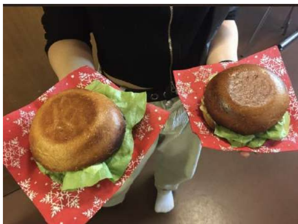
Burger Maison à Semsales

Parmi les projets 2023, nous pouvons citer, un tournoi de voiture télécommandée à Remaufens organisé par un jeune de Remaufens avec l'aide de l'animatrice et ouvert à toute la Veveyse, des ateliers pâtisseries en Haute-Veveyse, Basse-Veveyse et Châtel-St-Denis organisé spontanément et plus régulièrement durant les accueils, un atelier Bubble Tea à Attalens pensé par un groupe de jeunes filles, hormis les courses, ce sont les jeunes elles-mêmes qui ont géré l'activité le jour-j, une pizza party au Crêt, un atelier cuchaule à Châtel-St-Denis, celui-ci a été proposé par une maman d'une jeune, le matériel et l'activité amenés et gérés par elle-même, un atelier hamburger à Semsales, un jeu Incroyable Talent à Bossonnens sur plusieurs jours d'accueil, une vidéo explicative de l'Animation Jeunesse de la Veveyse avec un groupe de jeunes d'Attalens, un karaoké, un blind test, un Just Dance, un tournois à la switch de Mario Kart et plus encore !