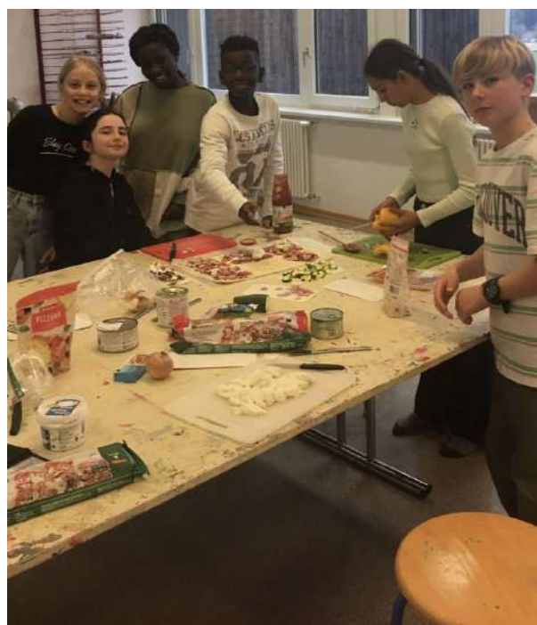
Pizza Party à Le Crêt