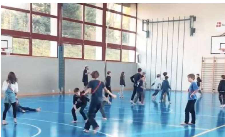
Accueil libre à la salle de gym d'Attalens

L'acquisition du véhicule de l'AJV en 2023 a favorisé ces concepts d'accueil libre puisqu'une variété d'activités sont mises à disposition de façon permanente et permet d'être spontané dans les animations. En effet, il y a une grande caisse de jeux de