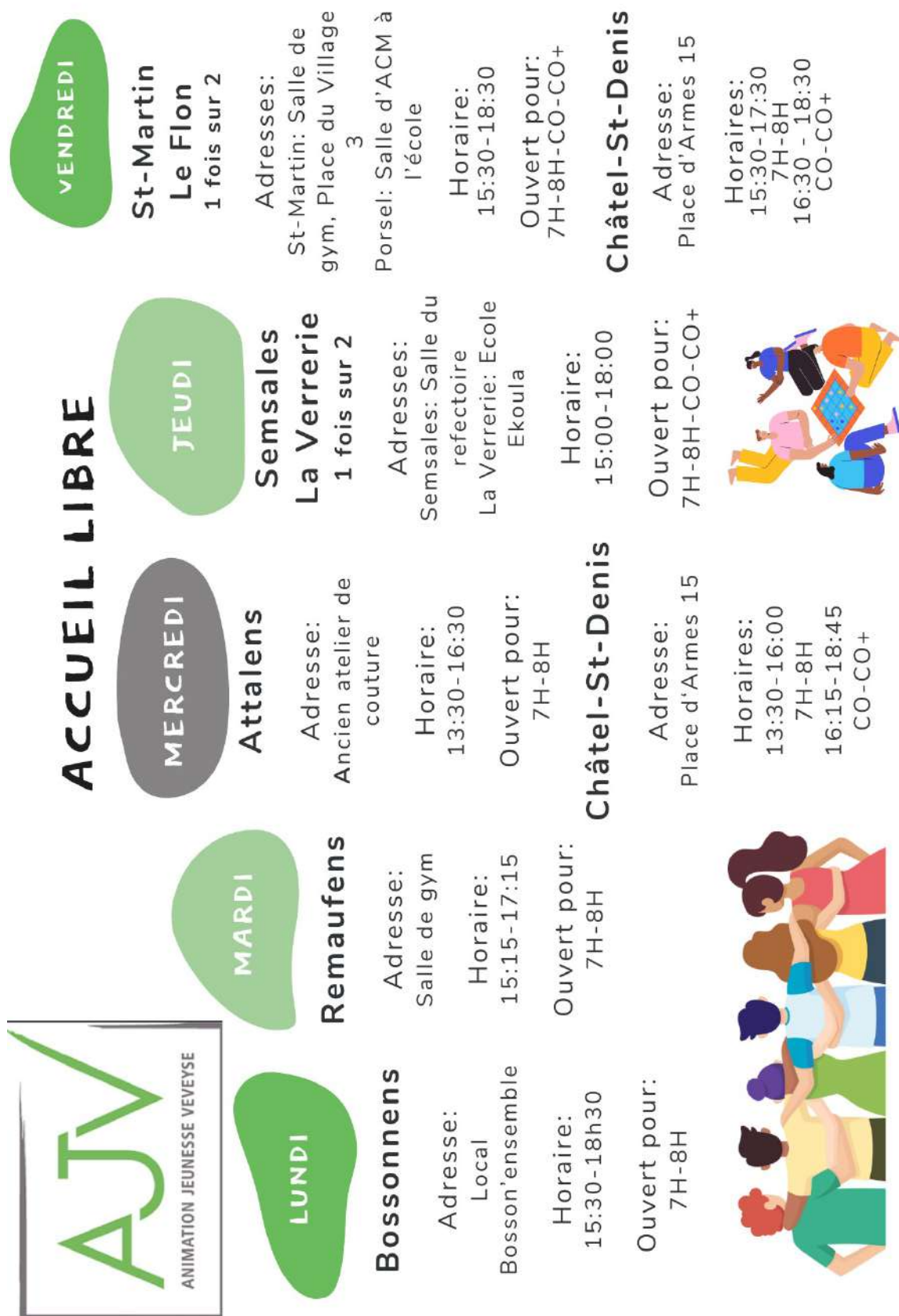
Nouveau flyer des horaires de l'accueil libre de l'AJV

Depuis la rentrée scolaire de septembre 2023, l'arrivée d'une nouvelle équipe pour le local de CSD et du véhicule de l'AJV, les horaires ont été remaniés, avec un jour supplémentaire d'accueil libre par semaine, soit 5 jours au total.