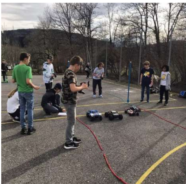
Parcours de voitures télécommandées à Remaufens