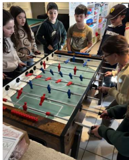
Tournoi de baby-foot improvisé avec les 7-8H au local de CSD

A Châtel-St-Denis, l'accueil a évolué puisqu'en 2023 une nouvelle collaboratrice a intégré l'équipe à la rentrée de septembre. Un cadre plus clair et ludique amène les jeunes à plus de sécurité et de respect.